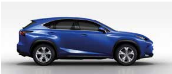
Exceed Blue Metallic (8U1)