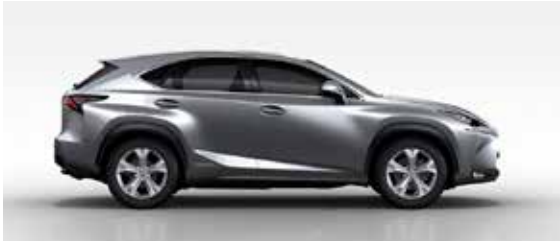
Platinum Silver Metallic (1J4)