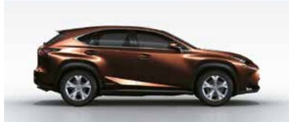
Amber Crystal Shine (4X2)