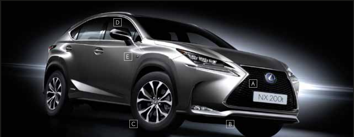
A Front mesh grille / B Front bumper / C Aluminum wheels / D Door mirrors / E Front fender emblems