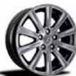
17-inch Aluminum Wheels