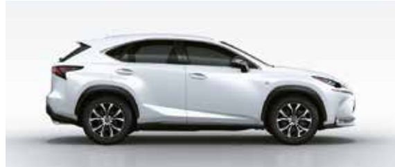
White Nova Glass Flake (083)