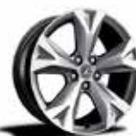
18-inch Aluminum Wheels