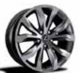
18-inch Aluminum Wheels, Dark Premium Metallic