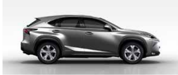
Sonic Titanium (1J7)