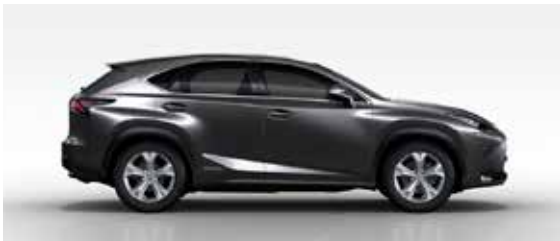
Mercury Gray Mica (1H9)