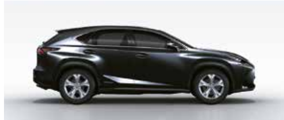
Graphite Black Glass Flake (223)