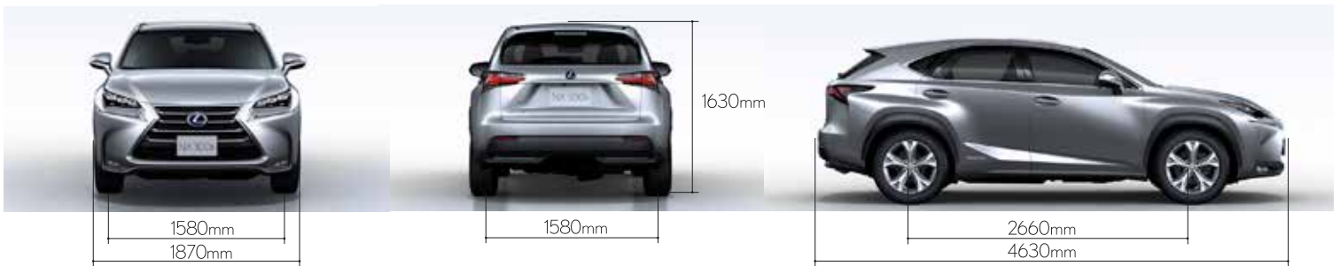
Note : Dimension of NX 300h Grand Luxury, Premium and F SPORT models only. มิติของรุ่น NX 300h Grand Luxury, Premium and F SPORT

*Total system output from the engine and electric motors (using the battery), based on in-house measurements.