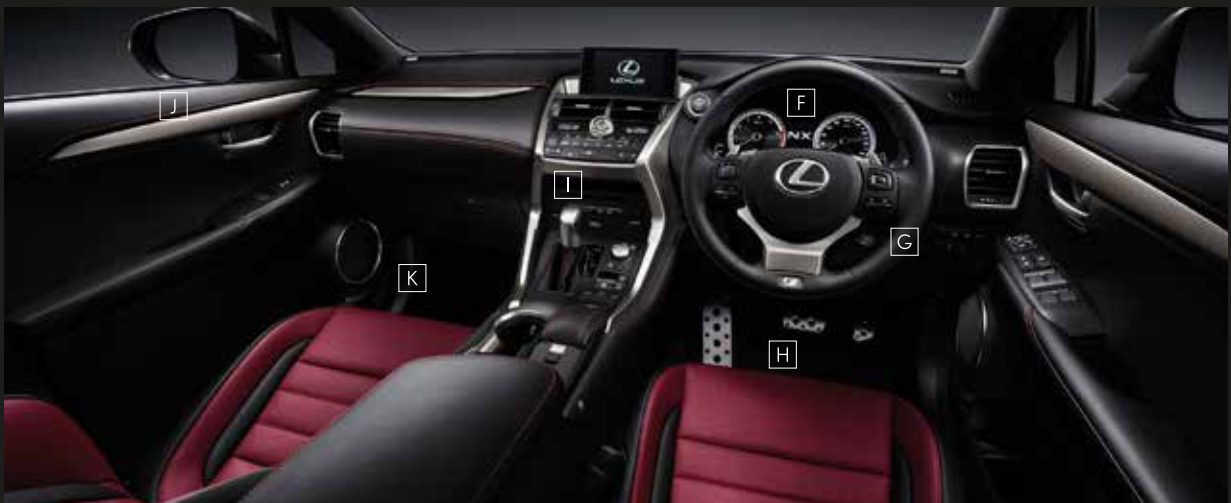
F Meters & multi-information display / G Steering wheel / H Aluminum pedals / I Shift lever knob / J Trim (Metal Film) / K Scuff plates