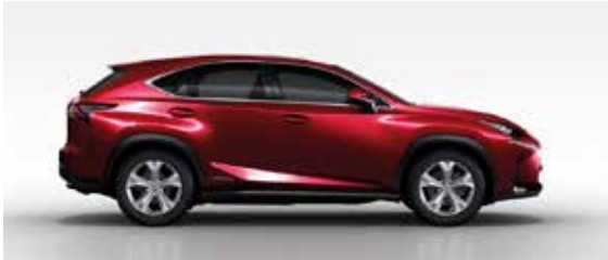
Red Mica Crystal Shine (3R1)