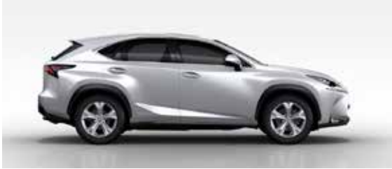
Sonic Quartz (085)